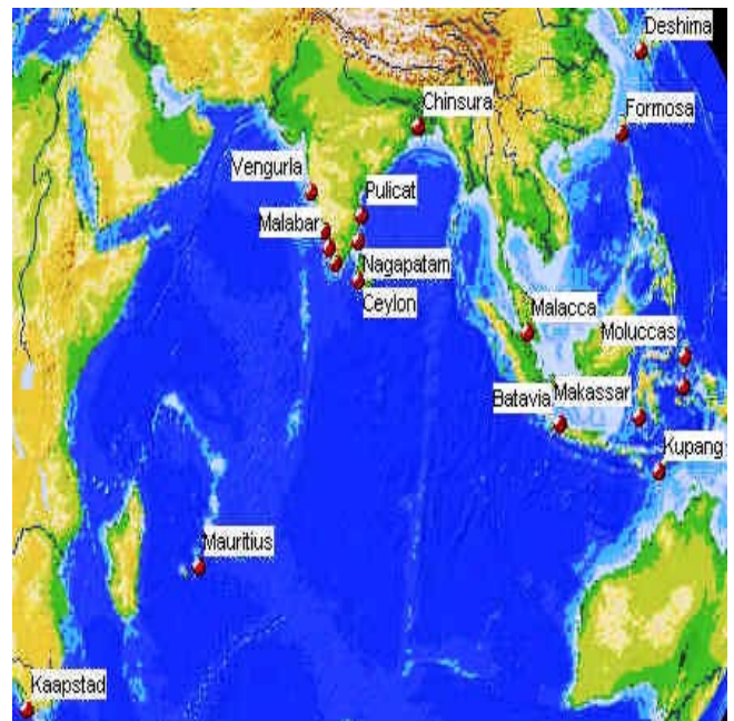
VOC kaart uit 1660