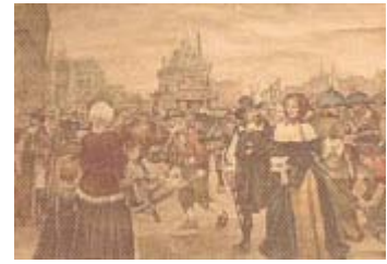
Oude schoolplaat: De Dam van Amsterdam in de Gouden Eeuw