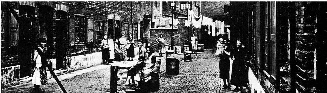
Straatbeeld 19de eeuw Amsterdam