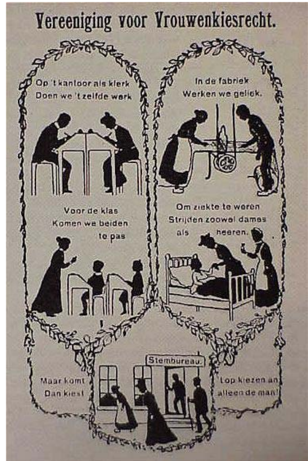
affiche voor vrouwenkiesrecht