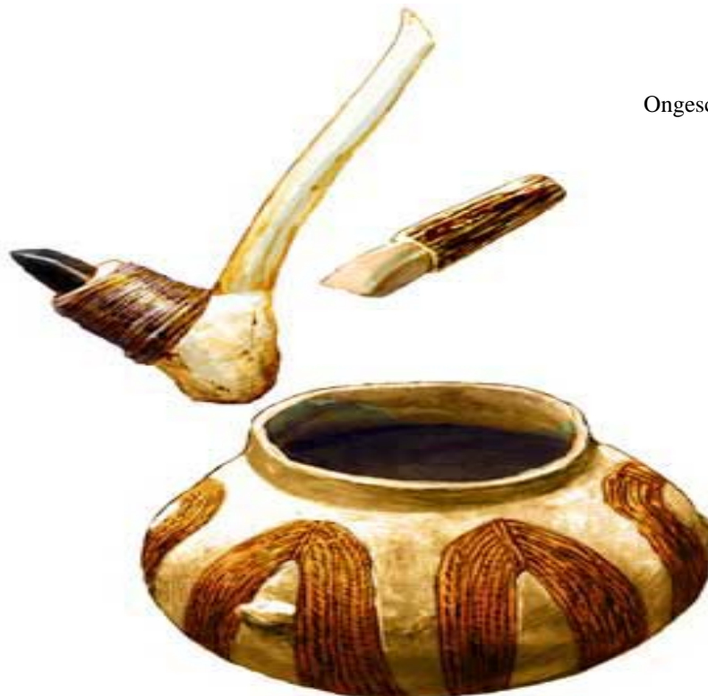
Ongeschreven bronnen uit de IJZERTIJD