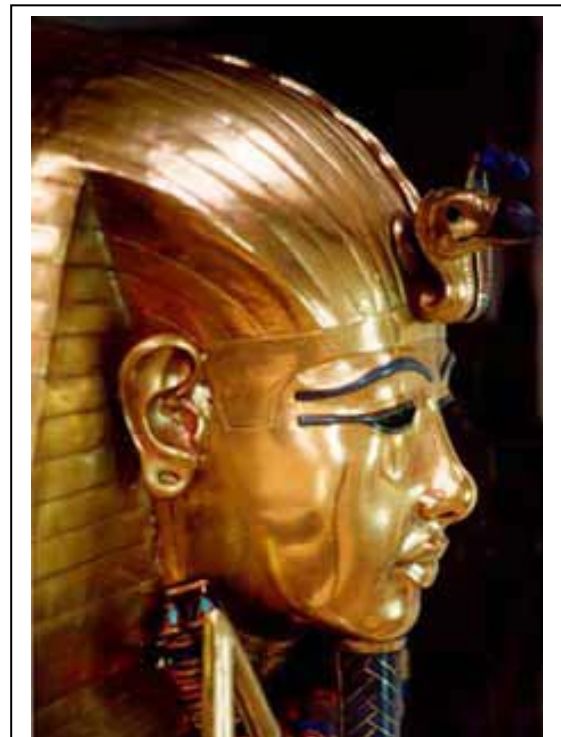
Het gouden dodenmasker van farao Toet-anch-amon